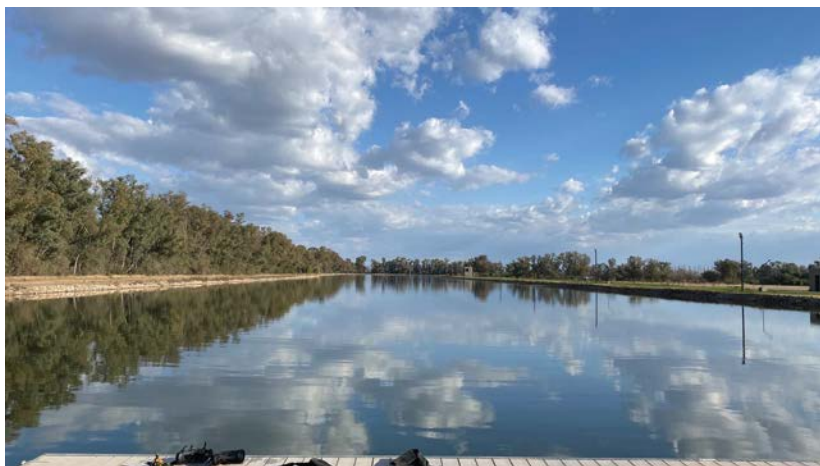
LAGO AHUMADA , VILLA DOLORES

La Federación de Esquí Acuático Argentino, tiene el agrado de invitar a los países miembros de la COLAEN al Campeonato Latino Americano de Esquí Acuático que se realizará en Argentina, en la Provincia de Córdoba.